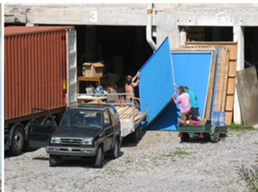
Die Holz Häuser (siehe unten) werden in den Container verladen.