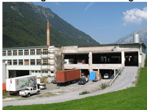
Unser Hilfsgüterlager befindet sich im unteren Teil der offenen Fabrikhalle. Der braune 40-FussContainer steht davor.