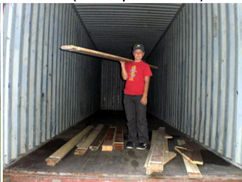
Am Samstag Morgen 7.9.12 Der Container ist noch leer.